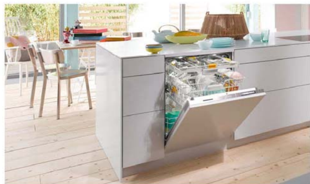
Geschirrspüler CH 55 / Euro 60 passend zu Ihrer Küche